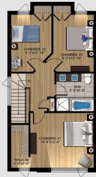
NIVEAU 2 696 pi 2