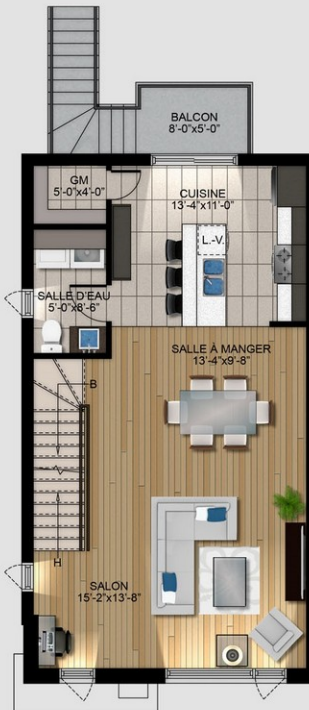
NIVEAU 1 720 pi 2